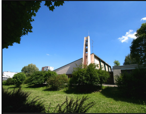
Eglise Protestante Cronenbourg-Cité