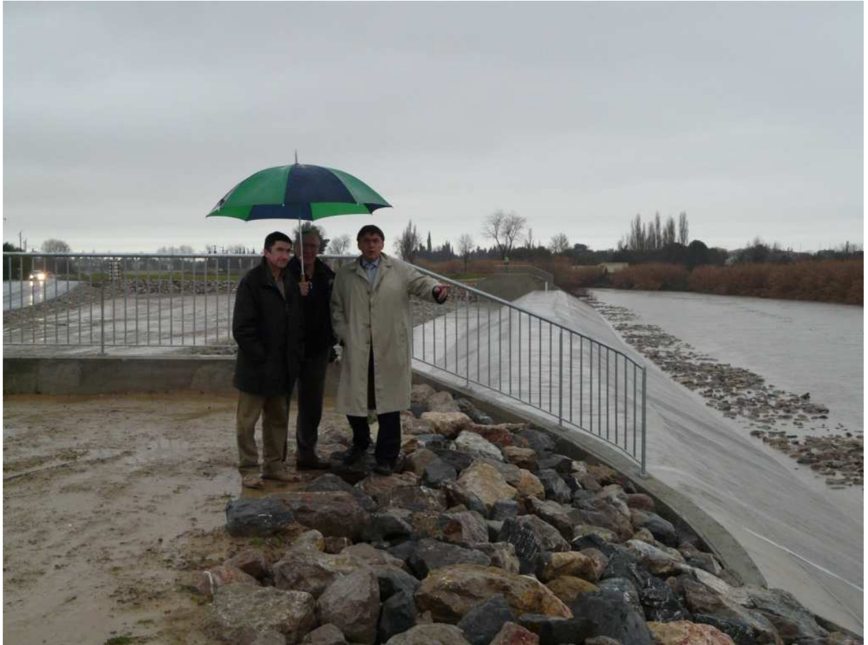
En surplomb du chenal de la Lironde