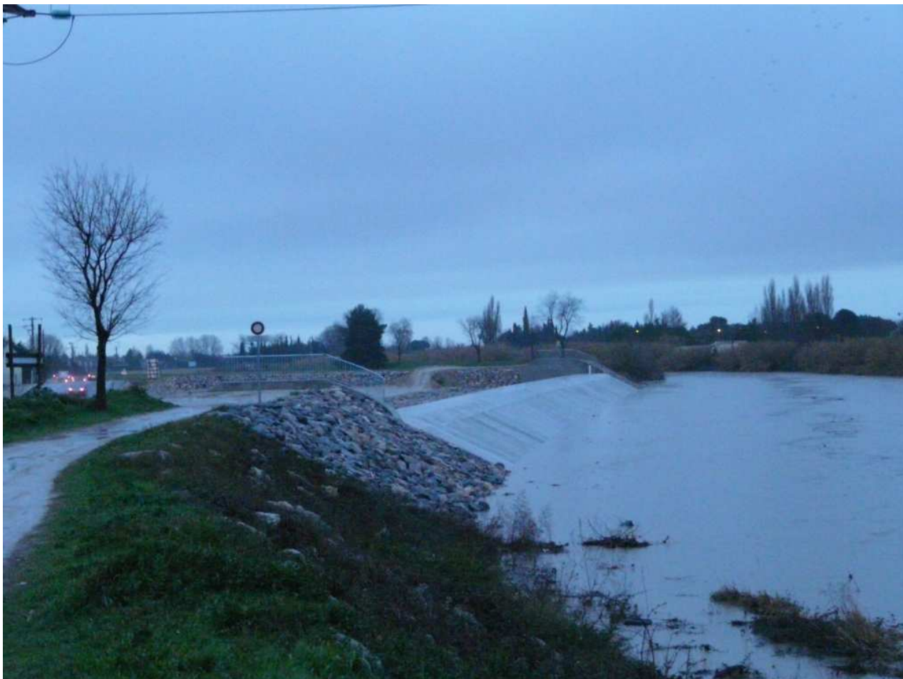
Le Lez au déversoir de la Lironde - 3 février 2009