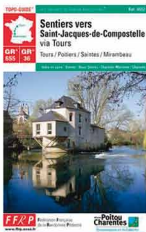
SENTIER VERS SAINT-JACQUES, TOURS - MIRAMBEAU