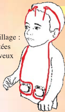
Schéma de l'appareillage : 2 électrodes implantées dans le système nerveux central reliées à 2 pacemakers (piles)

Mettant à profit sa passion pour le vélo et la moto, entouré de bénévoles, Patrick utilise sa collection pour aider l'Unité de Recherche sur les Mouvements Anormaux.