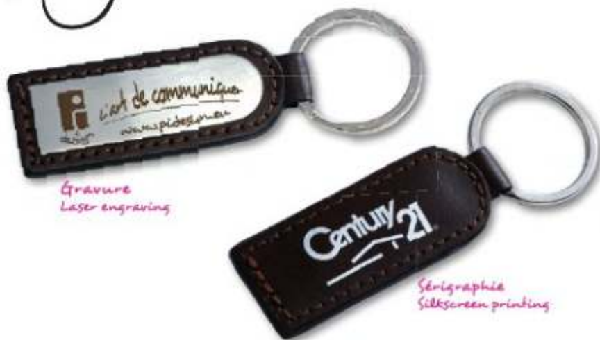
Gravure Laser engraving