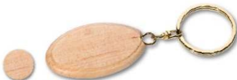
Érable Maple wood

Porte-clés bois. UNIQUEMENT en bois de rose (foncé). Dimensions : 58 x 40 x 8 mm (marquage 45 x 27 mm).