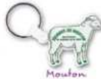
Mouton Marq. 20 x 11 Sheep Printing 20 x 11