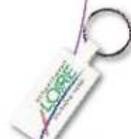
Rectangle Marq 90x27 Rectangle Printing 90x27