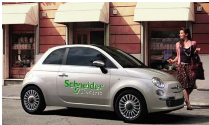
Voiture LLD à l'image Eco Vallée ?

Offrir une image d'entreprise dynamique et tournée vers l'avenir dans l'Eco-valée