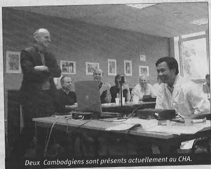
Deux Cambodgiens sont présents actuellement au CHA.