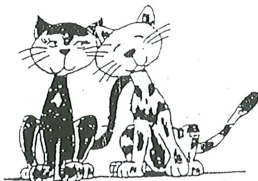
Moumoune et Mimi