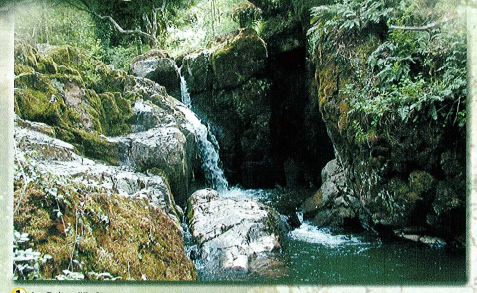
1 Le Puits d'Enfer

Une zone d'intérêt écologique protégée Nous vous rappelons que le site du Puits d'Enfer reste un site dangereux et escarpé et que la responsabilité de la Communauté de Communes "Arc en Sèvre" ne saurait être engagée en cas de manquement aux consignes de sécurité.