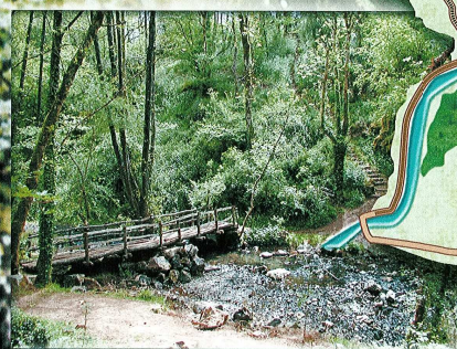
2 La passerelle