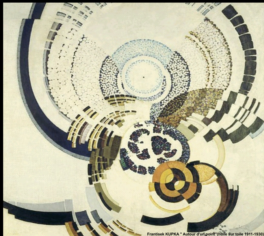
Frantisek KUPKA " Autour d'un point" (huile sur toile 1911-1930)

27 septembre 2009 - La Rochelle au Temple Protestant à 16h30 10 octobre 2009 - Luçon à la Chapelle Sainte Ursule à 20h30 11 octobre 2009 - La Roche-sur-Yon à l'église Notre Dame à 16h30