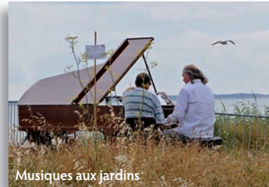
Musiques aux jardins