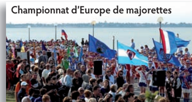
Championnat d'Europe de majorettes