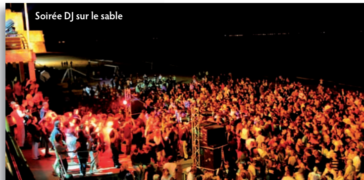
Soirée DJ sur le sable

La Lettre du Maire est une publication de la Mairie de Fouras : Place Lenoir - BP 69 - 17450 Fouras Directeur de publication : Sylvie Marcilly Rédaction : Commission Communication