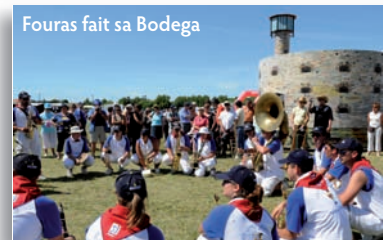
Fouras fait sa Bodega