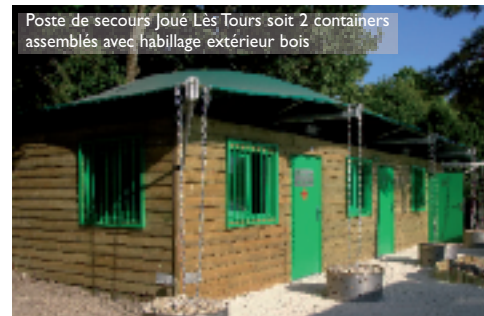
Poste de secours Joué Lès Tours soit 2 containers assemblés avec habillage extérieur bois

Imaginez un logement à la fois écologique, économique et atypique... Avec ses containers aménagés, SIRC donne une seconde chance aux containers maritimes en les transformant en lieux de vie, sanitaires publics, bureaux, logements, cuisine, guinguette,