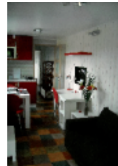
Intérieur salon salle à manger habitation 27m 2 base container 40 pieds

pourquoi s'en priver ? Conformés à la RT 2005, prêts à poser, les containers de SIRC, véritables alternatives économiques et écologiques, représentent un investissement intelligent et mesuré de valorisation de surfaces disponibles. Espérons que les investisseurs, financiers et autres promoteurs sauront saisir le coche... ●