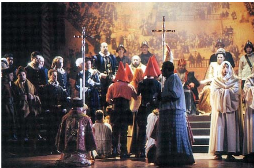
« Don Carlos », dans une nouvelle production de l'Opéra-Théâtre de Metz en 1999