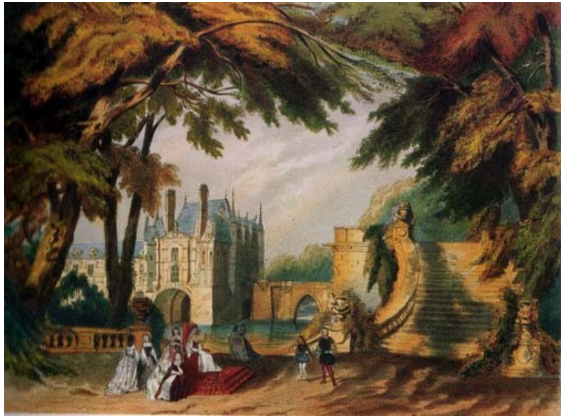
Décors de l'acte II des « Huguenots » de Meyerbeer (1836) d'après Despléchin (Bibliothèque Nationale de l'Opéra de Paris)