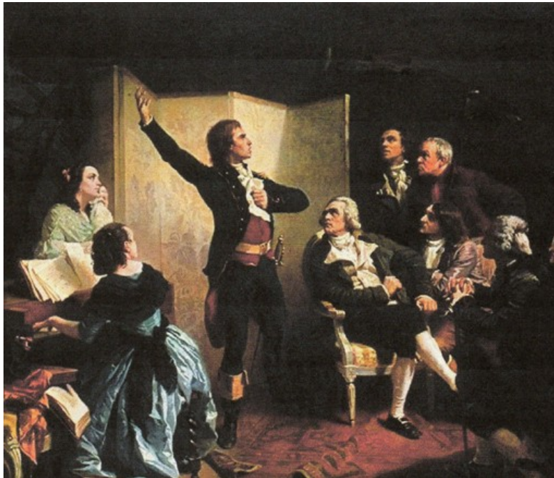
« Marseillaise » chantée par Rouget de Lisle dans le salon du maire de Strasbourg, le baron Dietrich, le 24 avril 1792 (Tableau Isidore Pils)