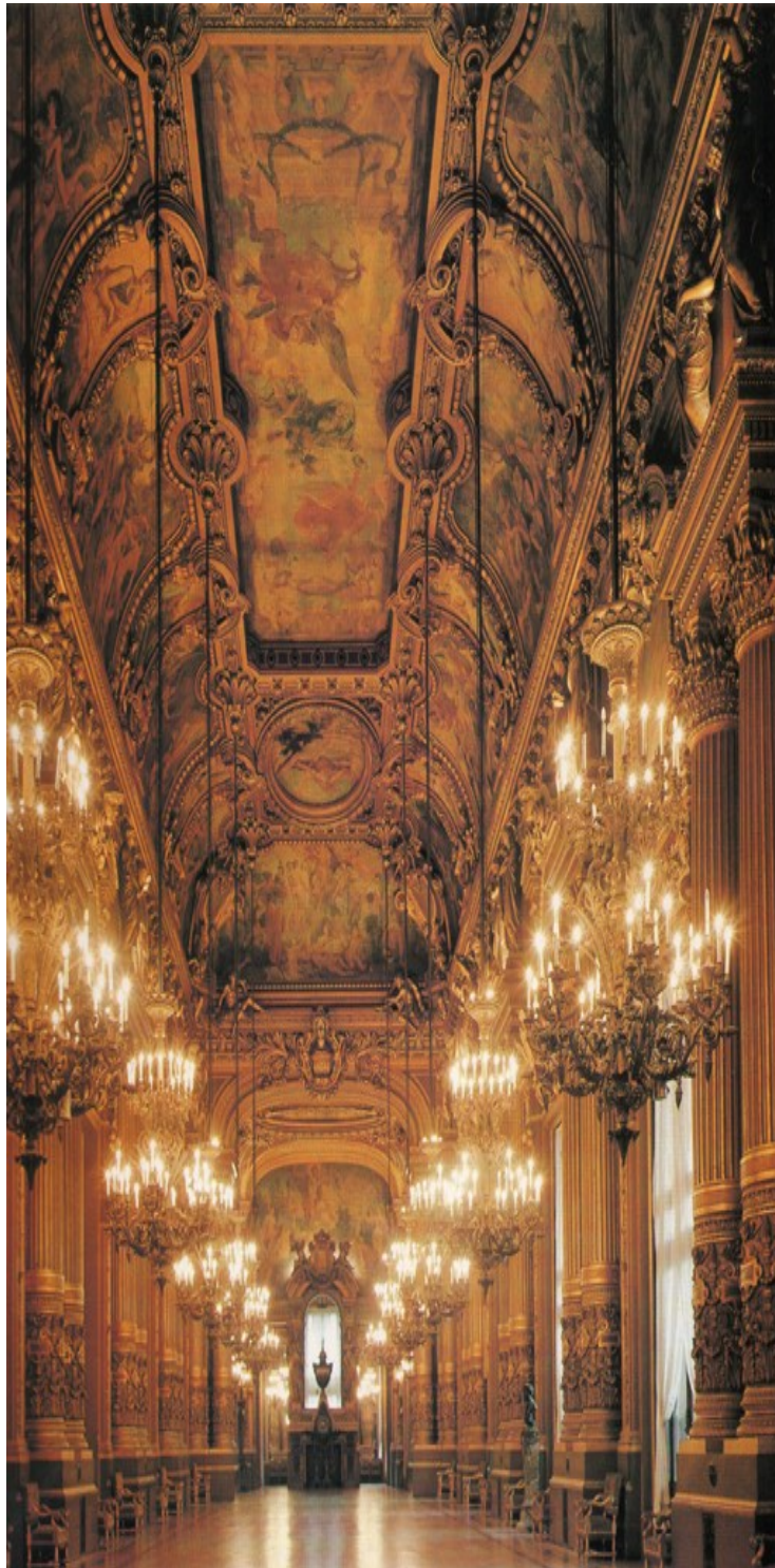
Grand foyer de l'Opéra Garnier