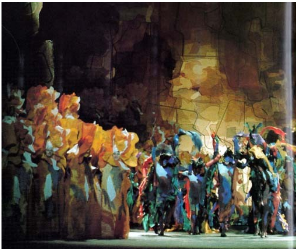
« Orphée et Eurydice » de Gluck, dans une chorégraphie de Balanchine à l'Opéra de Paris en 1973