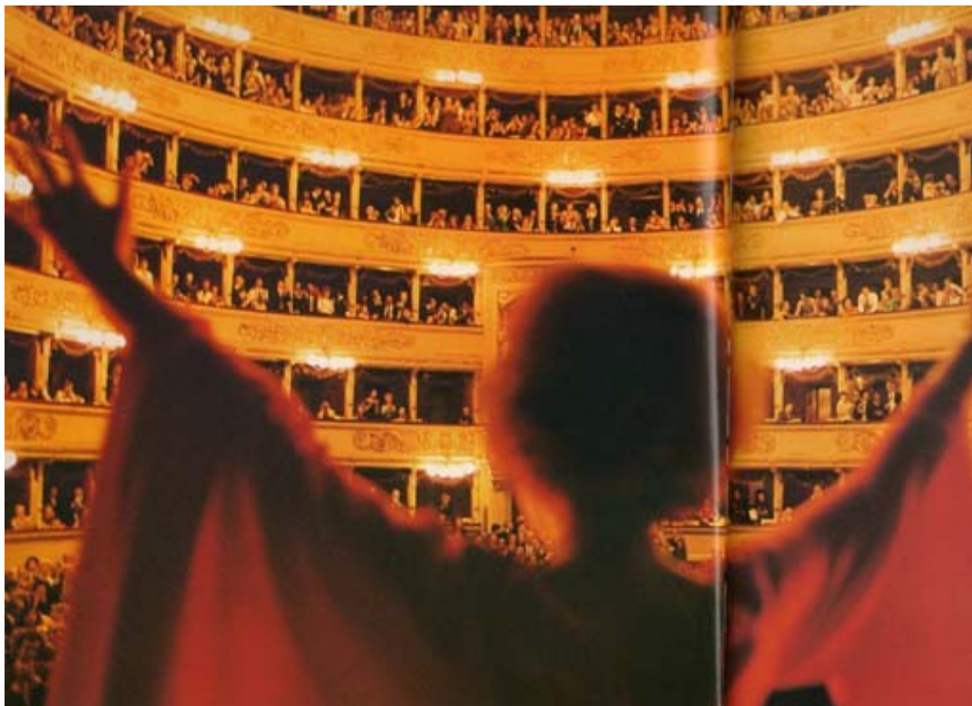
Renata Tebaldi, de dos, applaudie à l'issue d'un concert à la Scala de Milan