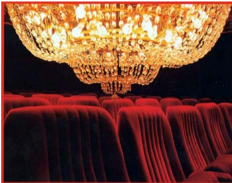
Grand lustre sur fauteuils...à l'Opéra-Théâtre de Metz

Air de Giulietta extrait de I Capuletti e i Montecchi , opéra de Bellini ; Air « Tu che accendi – Di tanti palpiti », extrait de l'opéra Tancredi de Rossini ; Air du « Cours la Reine », extrait de Manon de Massenet ; « Chanson de Fortunio » de Jacques Offenbach ; Air de « Fanny » extrait de Marius et Fanny de Vladimir Kosma.