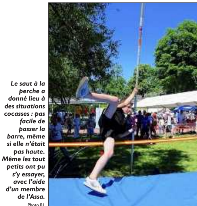
Le saut à la perche a donné lieu à des situations cocasses : pas facile de passer la barre, même si elle n'était pas haute. Même les tout petits ont pu s'y essayer, avec l'aide d'un membre de l'Asso.