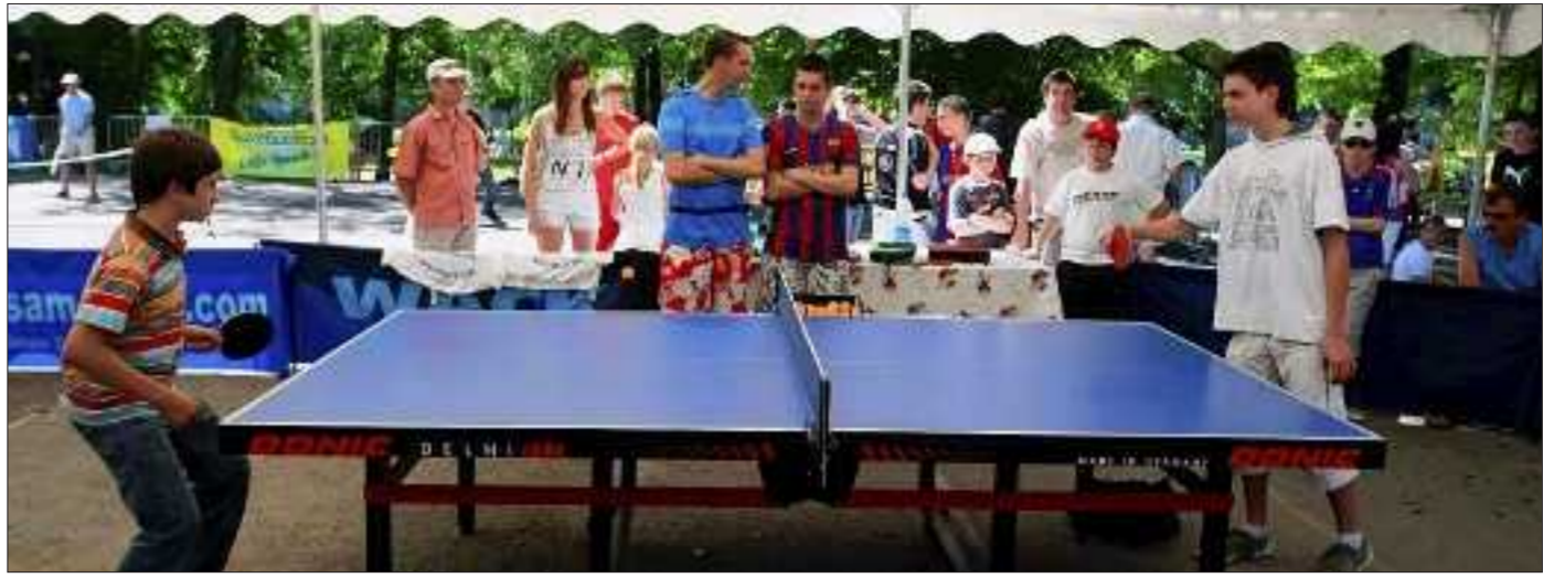
Tennis de table, mini-tennis et badminton ont occupé l'ancien terrain de tennis des Faïenceries, récemment nettoyé et ouvert. Le badminton était représenté pour la première fois cette année.

C'est le nombre d'associations qui se sont partagées l'esplanade du Casino et ses abords.