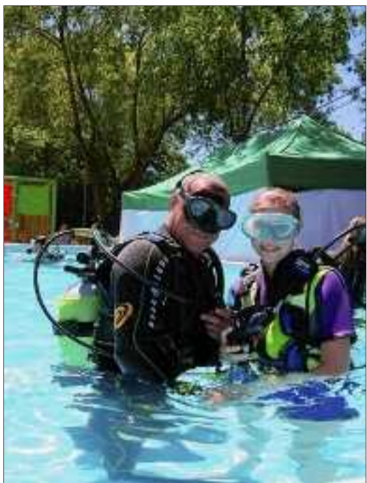
La plongée sous-marine dans une grande piscine est toujours une activité très courue à la fête du Sport.